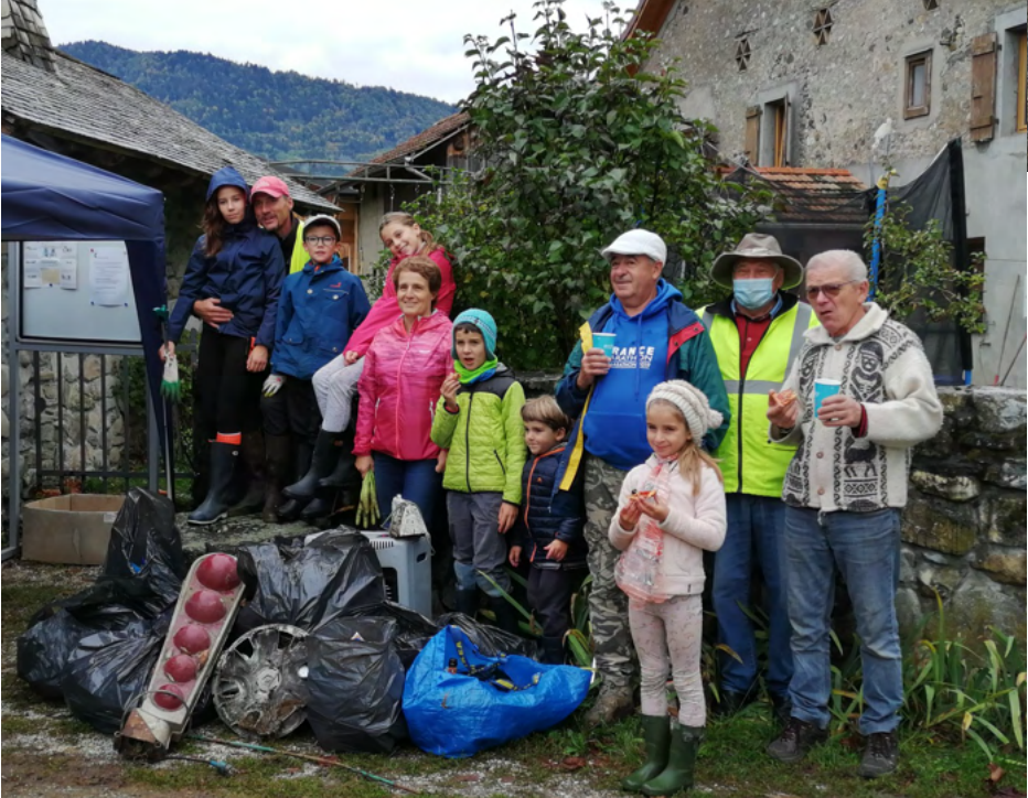
Une belle récolte sur la route d'Arthaz