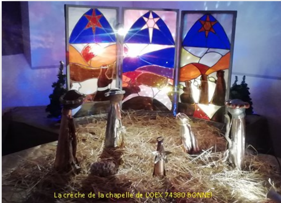
La crèche de la chapelle de LOËX 74380 BONNE!