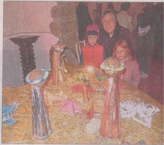
Une crèche réalisée par deux artistes et créateurs locaux.

Mardi 24 décembre, dans l'après-midi, la chapelle Saint-Eusèbe de Loëx à Bonne, des familles du bourg, et même quelques autres des alentours, se sont retrouvées pour une célébration de Noël, devant la crèche conçue et réalisée par deux artistes et créateurs locaux, Gino et Bernard. Communion des pensées et recueillement pour cet instant. Le thème des Rois mages était à l'honneur : un simple rappel historique, des lectures de poèmes et de l'Évangile, des chants, des prières. Les enfants, à leur tour, ont décoré la crèche, avec de brillantes étoiles de leur fabrication.